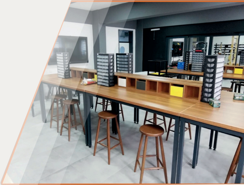
Figure 1: A high school's Design and Skill Lab from Ankara, Türkiye (MNE, 2022, p. 24)

be connected in these spaces. DSLs provide learners with the following multiple domains at the elementary and middle school levels (MNE, 2022), including the Wood and Metal Lab, the Drama and Critical Thinking Lab, the STEM Lab, the Visual Arts Studio, the Music Studio, the Sports Areas, the Life Skills Lab, the Software Design Lab, the Nature, and Animal Caring Lab. Similarly, there is only one lab designed for high school students that is more interdisciplinary and holistic, called the Science and Arts Lab, where art and science are connected in one space. The Ministry of National Education funded schools that wanted to create the space and conducted teacher professional development workshops in different domains. In addition, the Ministry created guiding books for teachers, students, and administrators.