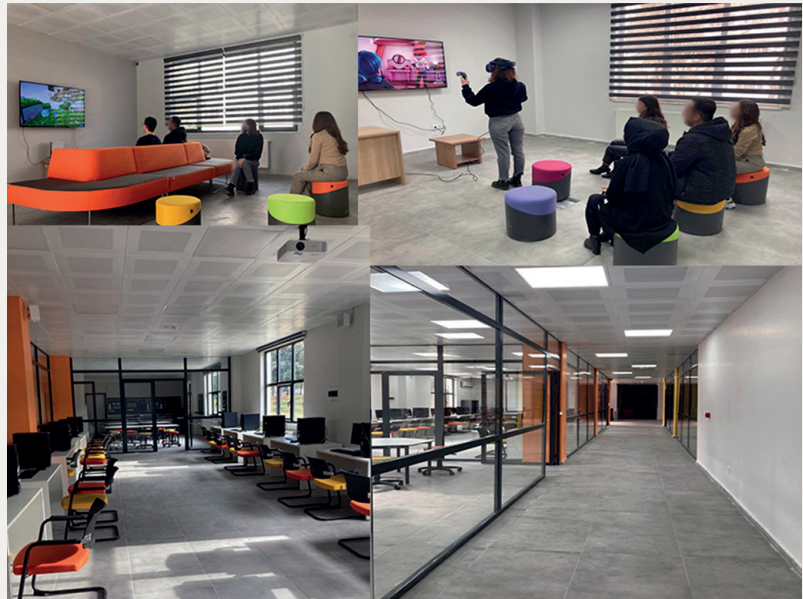
Figure 2: Photos from a technology-enhanced learning space for pre-service teachers

Based on the interview and survey data we collected, to prepare future teachers for technology-enhanced learning environments, we need to make sure that they all have a certain level of proficiency in English to access and understand available resources online and improve their necessary knowledge and skills. Knowledge of STEM areas and technical skills are essential competencies that need to be developed. Future teachers need to be given technology literacy (using the Internet effectively) skills and advanced technical knowledge, including basic computer programming and 3D modeling. Using hand tools and safety in these environments are also crucial for this preparation. Assessment in open-ended projects is another area for improvement. It is essential for future teachers to experience, design, and implement project-based assessment strategies in these spaces.